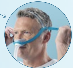
Anpassung des hinteren Bandes