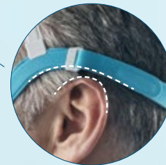
Kontrolle des Abstands

Weitere Anweisungen finden Sie im Abschnitt zum Anpassen der Maske in der Gebrauchs- und Pflegeanleitung von Evora.