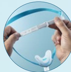
Anpassung des oberen Bandes